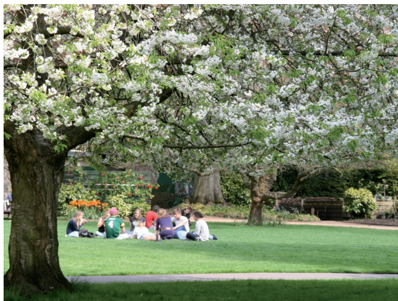
Raumstrukturierende Baumreihe entlang des Rasencarrées