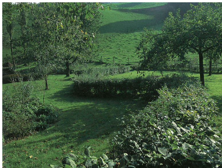
Übergang ins Kulturland