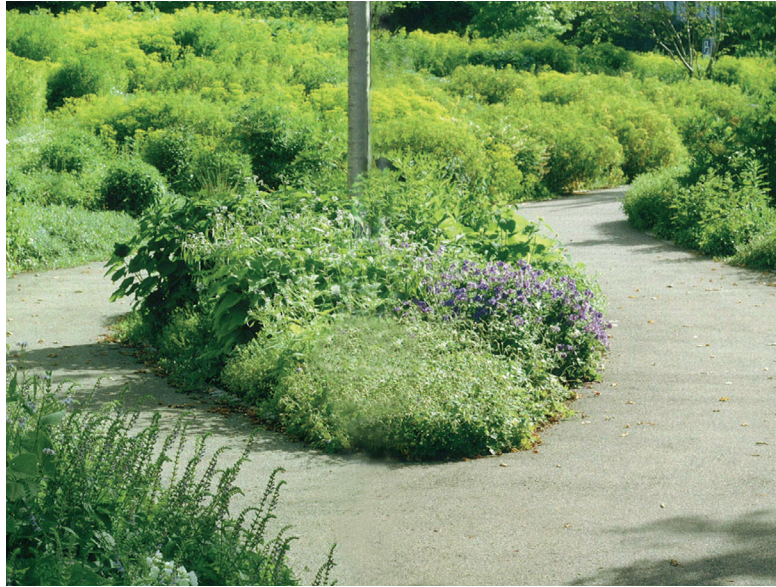
Weg durch ruderales Staudenfläche