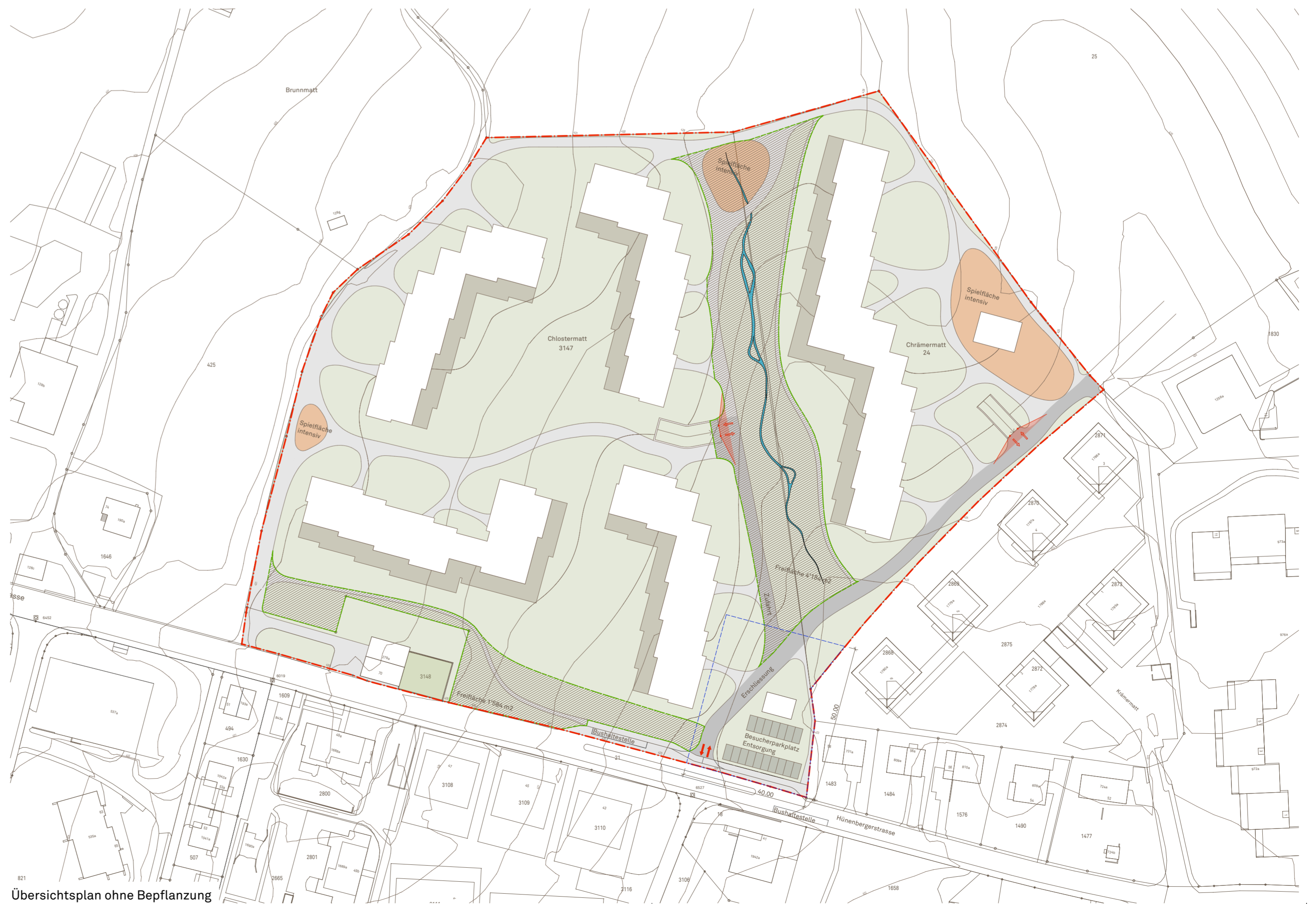
Übersichtsplan ohne Bepflanzung