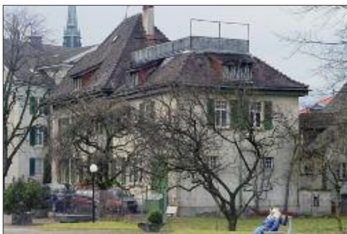
Die Hinterseite des «Doktorhauses» vor dem letzten Umbau.