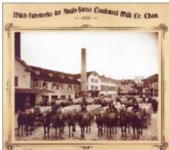
Der ganze Platz voller Milchfuhrwerke für die Fabrik.