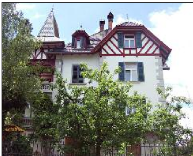
Liebliche Vorstadtvilla mit interessanter Geschichte.