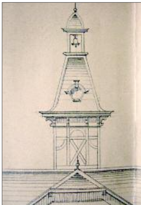
Detail aus dem Bauplan für das Türmchen.