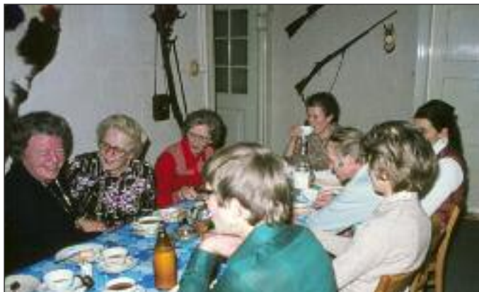
Familienalltag im «Technikum».

Im Jahre 2013 ist die Chamer Milchfabrik längst Geschichte, dafür ist der Wohnungsbau für sozial Schwache ein grosses Thema. Die Chamer Stimmbürgerinnen und Stimmbürger bejahten mit knapp 67 Prozent den Kauf des Gebäudes für vier Millionen Franken. Im «Technikum», das mittlerweile unter kantonalem Denkmalschutz steht, bietet die Einwohnergemeinde preisgünstige Wohnungen an.