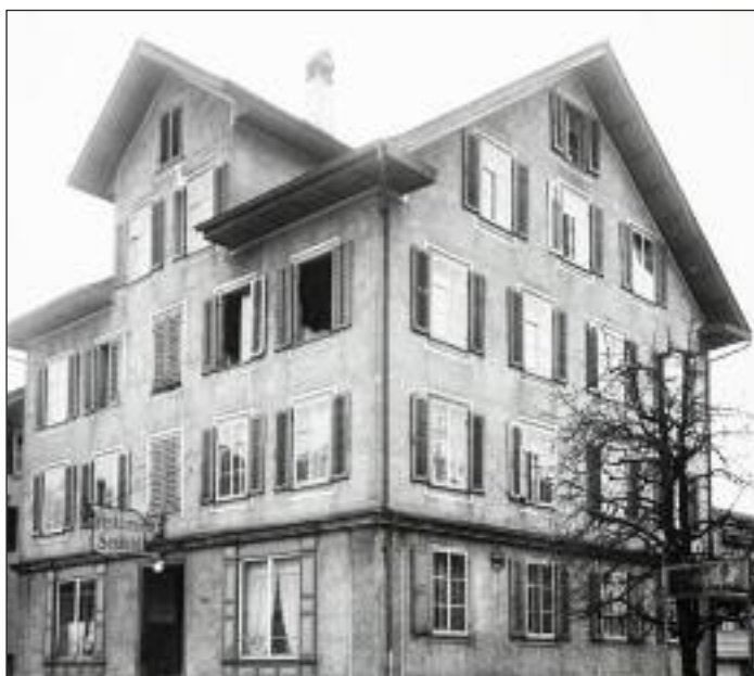
Das Wirtshausschild über der Eingangstüre lockte die Gäste an.