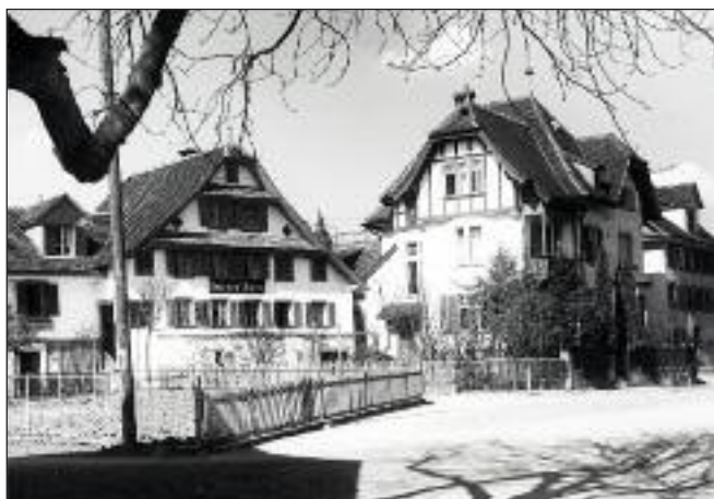
Illustre Häuserzeile mit «Schliess», «Doktorhaus» und Gigeriweid.