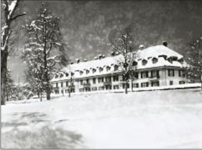
Malerische Aufnahme des «Technikums».