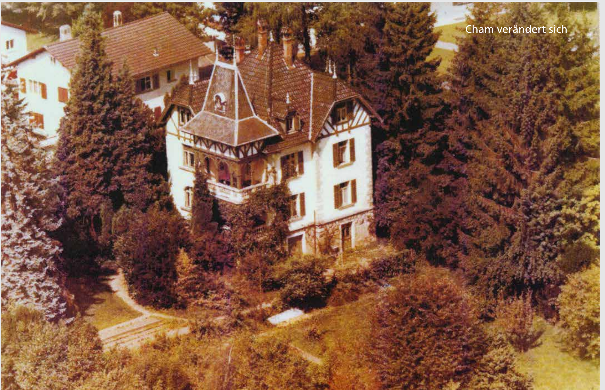
Die Villa Seematt von oben gesehen: umgeben von hohen Bäumen und ohne Häuser im Osten.