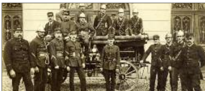
Die Chamer Feuerwehr 1921 vor dem Spritzenhaus.

Cham ist in den letzten Jahrzehnten stark gewachsen – dementsprechend musste sich auch die Feuerwehr vergrössern. 1987 zog die Feuerwehr mit ihren Fahrzeugen und dem Löschmaterial in den neuen Werkhof an der Sinslerstrasse. Seither beherbergt das Spritzenhaus Unterrichtslokale der Chamer Musikschule sowie Proberäume für Chamer Musikvereine und ist damit eine Art Chamer Musikhaus geworden.