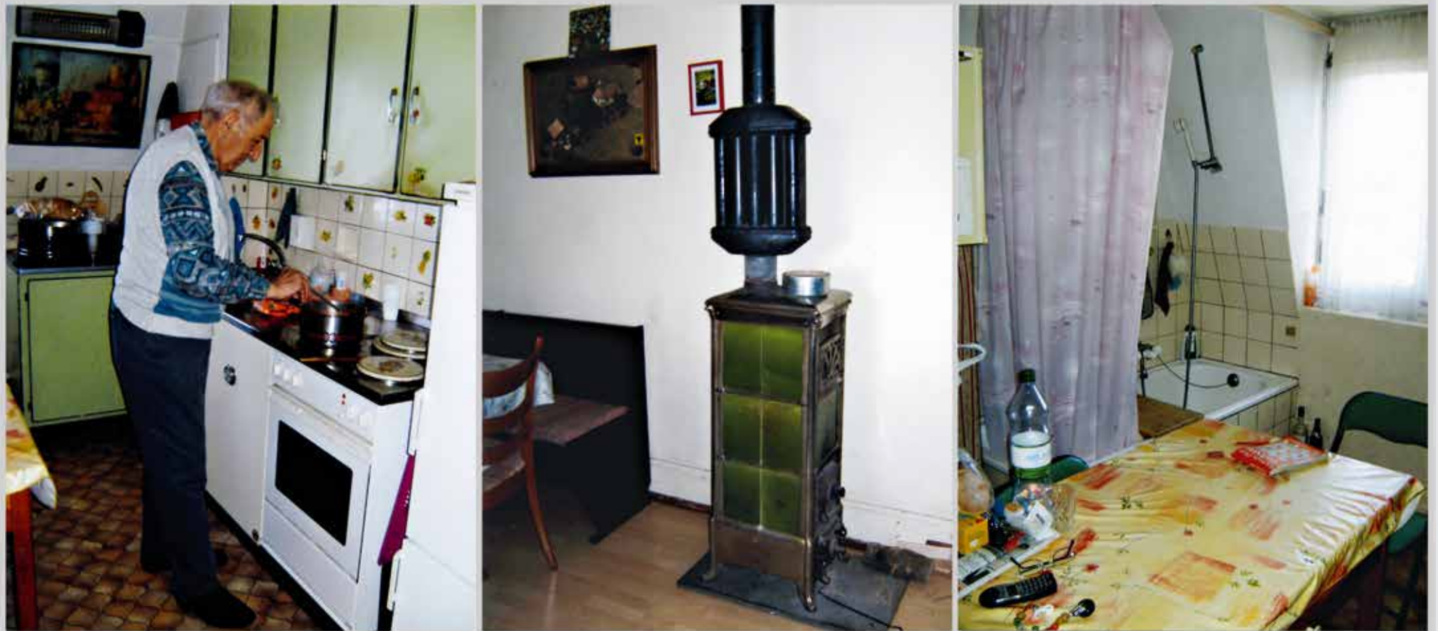
Einfach, aber funktionell und mit Kleinstbadewanne: Familienwohnung im «Technikum».