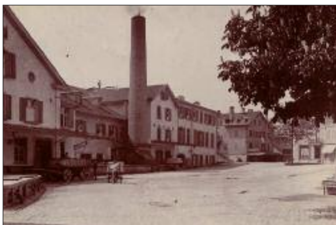
Bei der Rampe links wurde die Milch angeliefert.

Das bedeutete, dass unzählige Bauern zwischen Küssnacht am Rigi und dem Säuliamt, zwischen dem Lindenberg und dem Ägerital ihre Milch der Chamer Milchfabrik verkauften. Täglich transportierten Fuhrwerke die frische Milch von den Bauernhöfen nach Cham. Auf ein durchschnittliches Fuhrwerk passten 80 Milchkannen à 30 Kilogramm, das machte pro Fuhrwerk eine Ladung von 2,4 Tonnen. Dementsprechend schepperten die Transporte der Milchkannen auf den damals einfach planierten Strassen in und nach Cham.