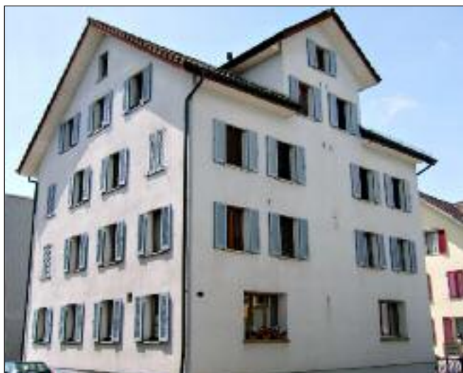
Das grosse Haus Seefeld beherbergte einst eine bekannte Wirtschaft.