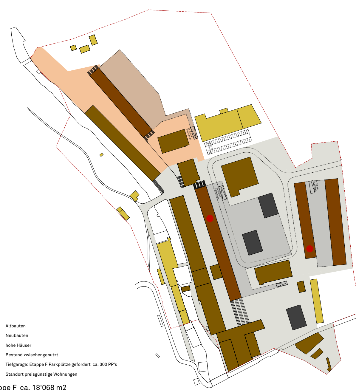
Etappe F ca. 18'068 m 2