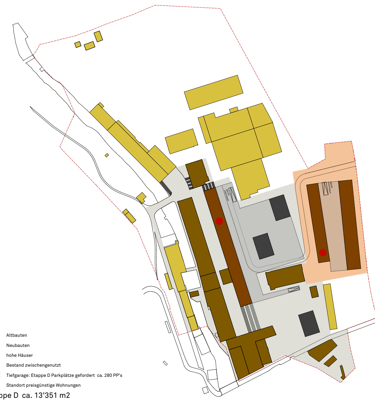
Etappe D ca. 13'351 m 2