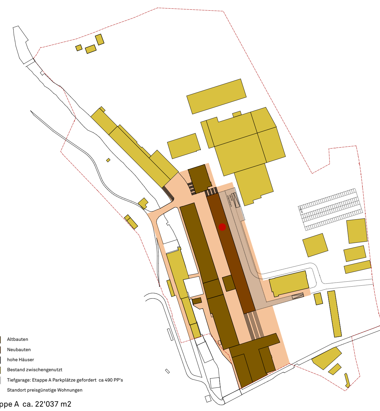
Etappe A ca. 22'037 m 2