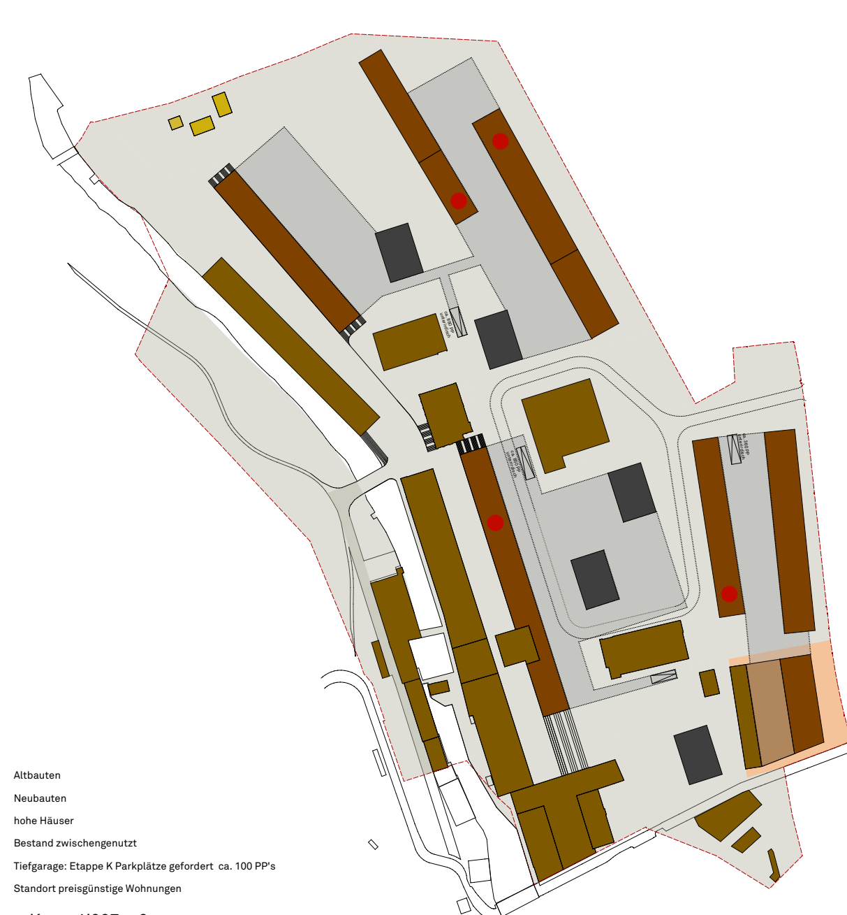
Etappe K ca. 4'027 m 2