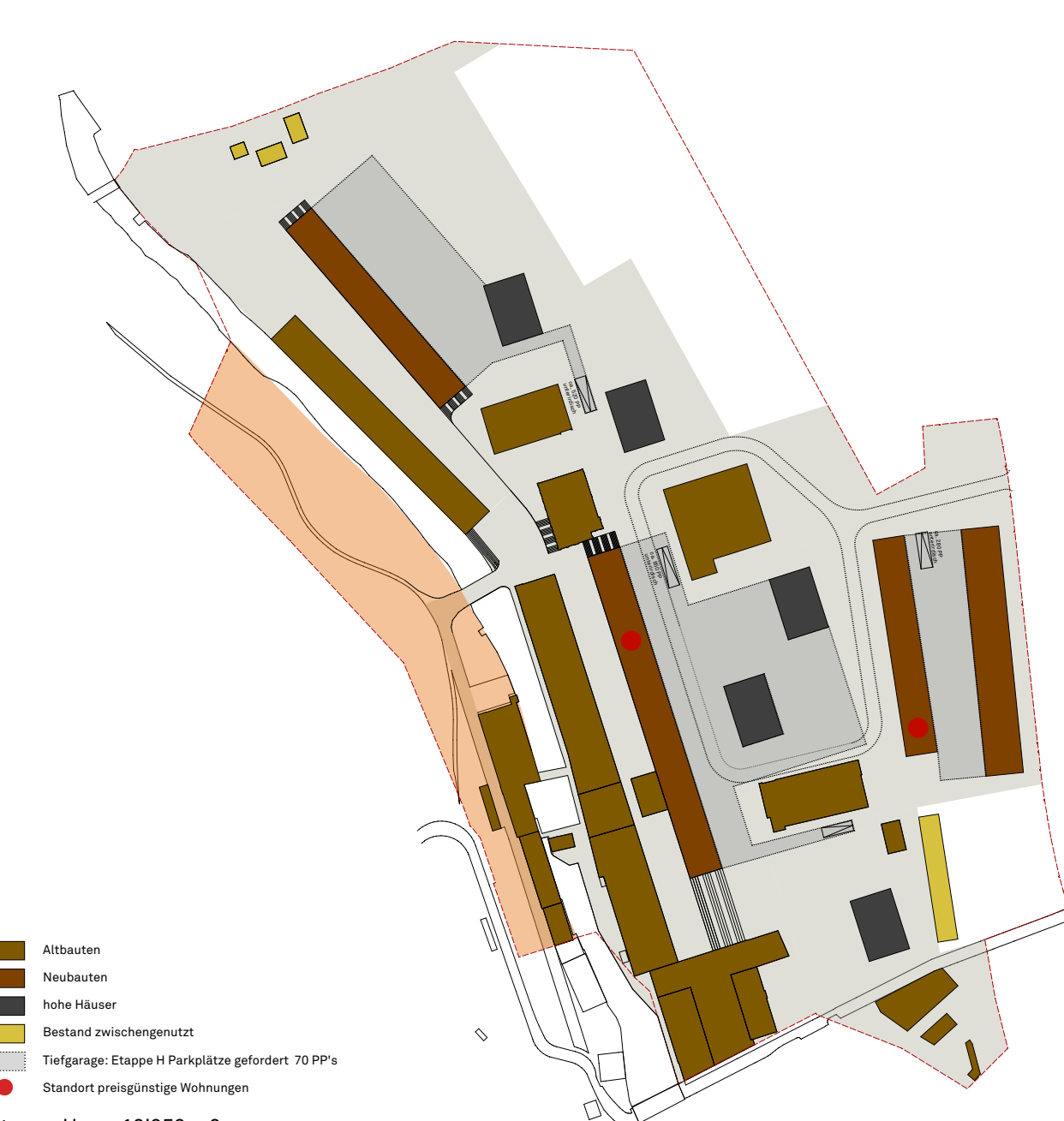
Etappe H ca. 12'959 m 2