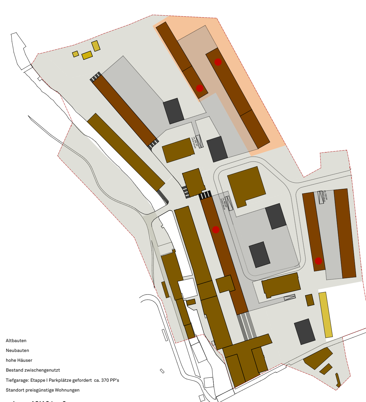
Etappe I ca. 13'164 m 2