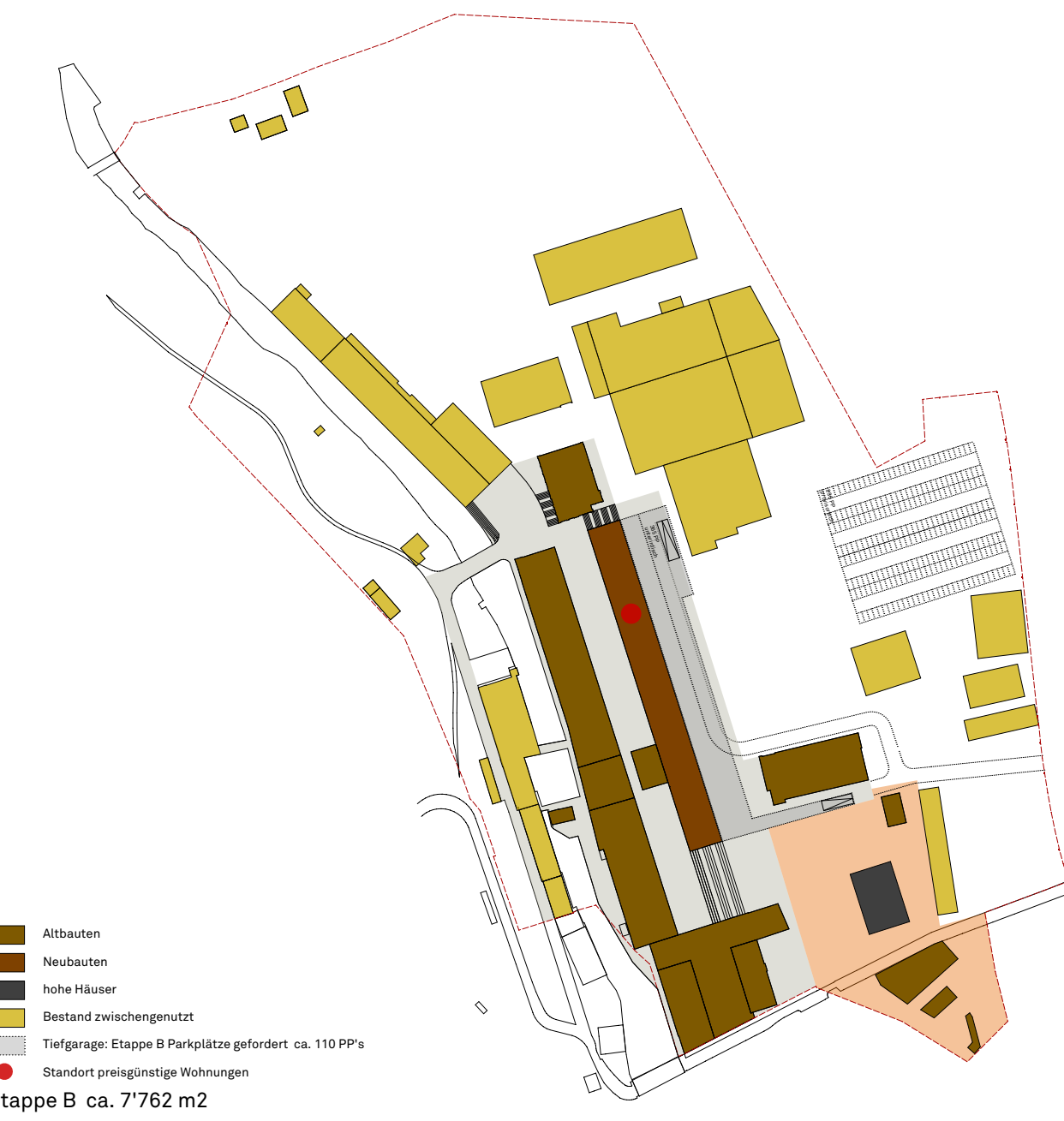
Etappe B ca. 7'762 m 2