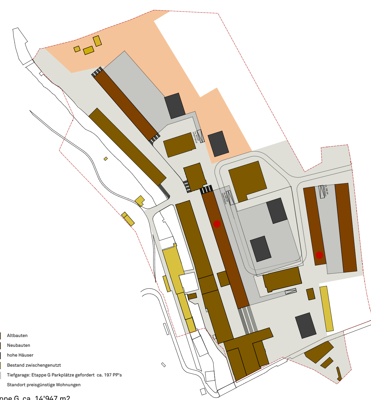
Etappe G ca. 14'947 m 2