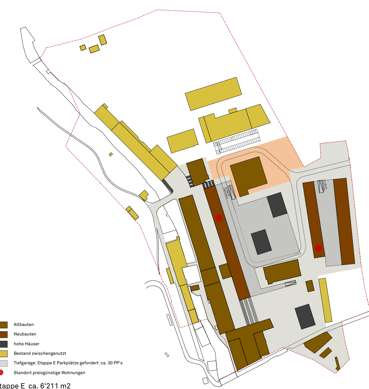
Etappe E ca. 6'211 m 2