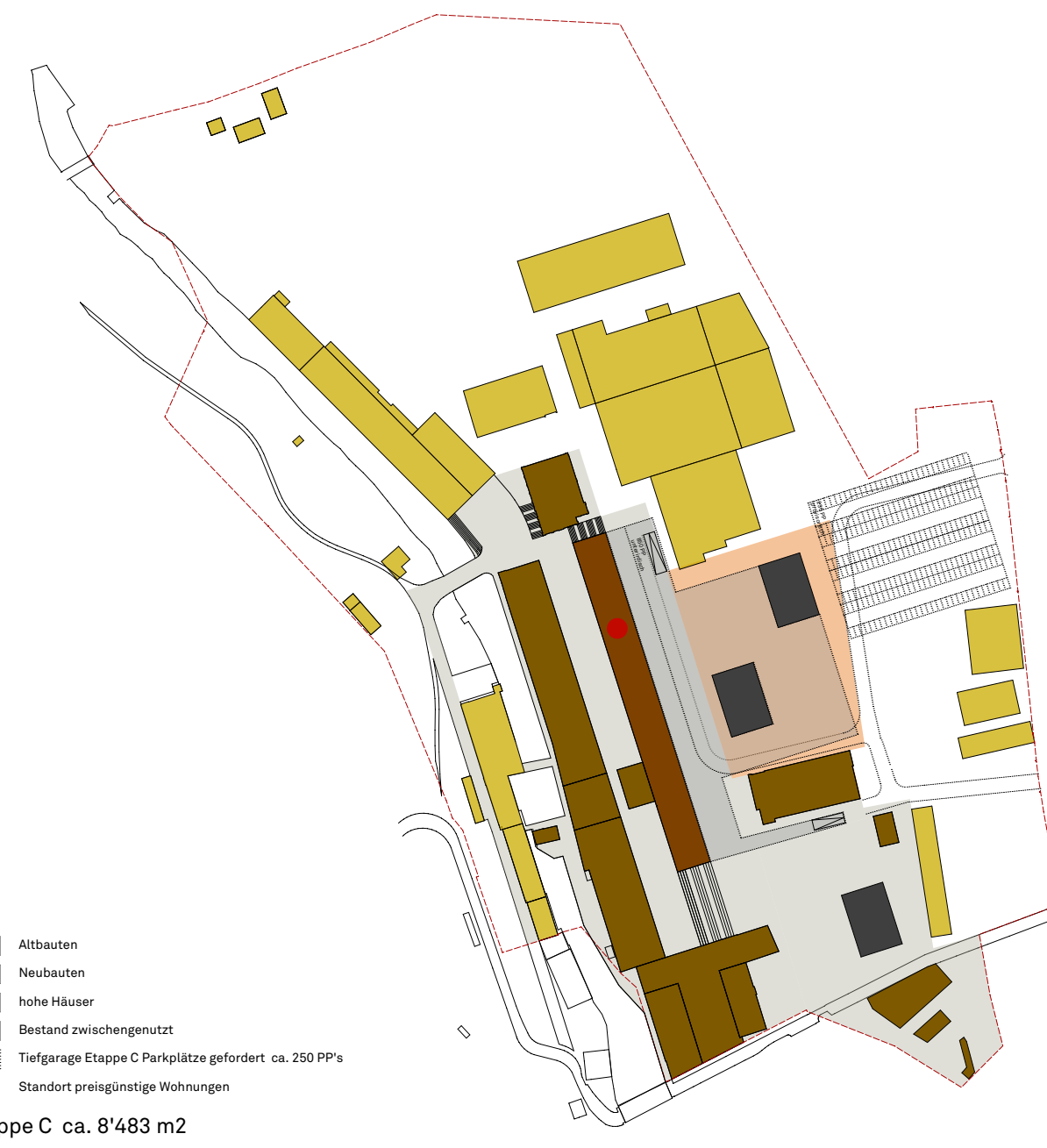
Etappe C ca. 8'483 m 2